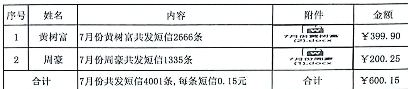
天然居2023年7月份地下室员工通讯短信补贴明细表