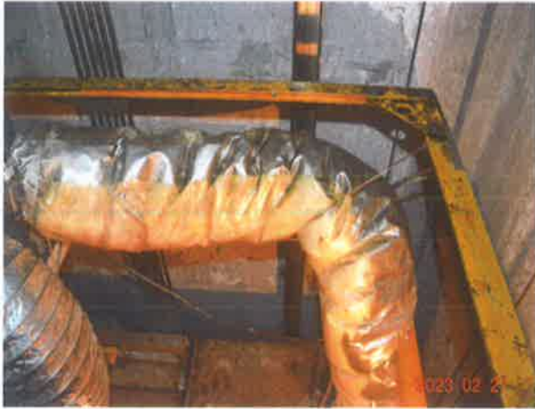
图 19：轿顶护栏设置不符合现行标准要求