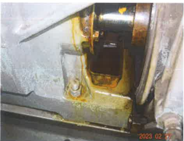
图 11：减速箱存在渗漏油现象