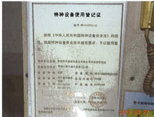
图 1: 电梯使用登记证