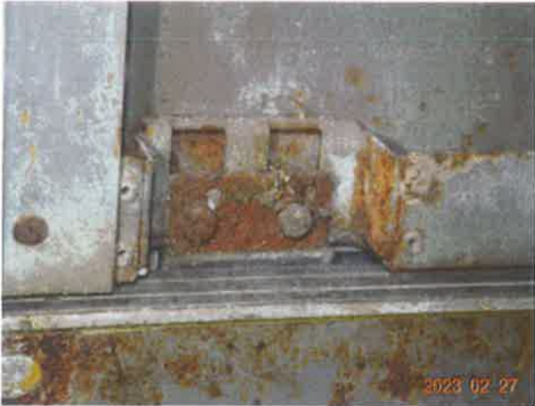
图 21：部分层门门滑块锈蚀磨损