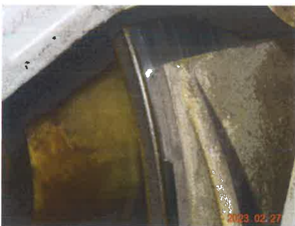
图 12：制动轮表面残留润滑油痕迹