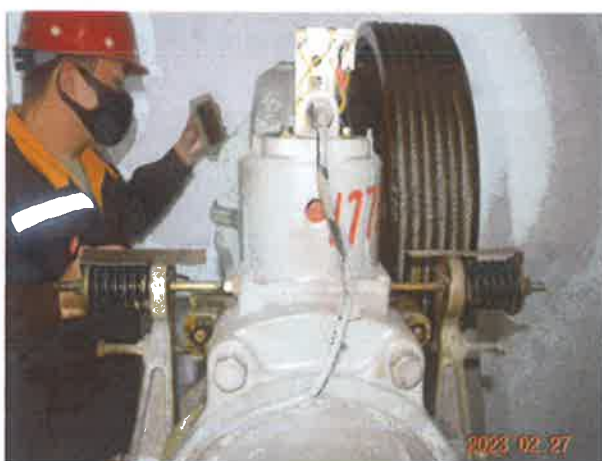
图 10：制动器仅由一组机械部件（铁芯）组成