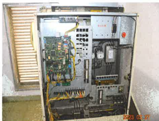
图 5: 上海三菱电梯有限公司控制柜