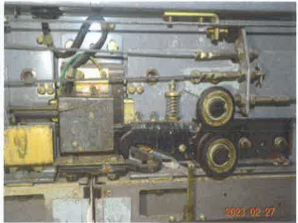
图 20：人为短接门锁电梯仍能再次启动