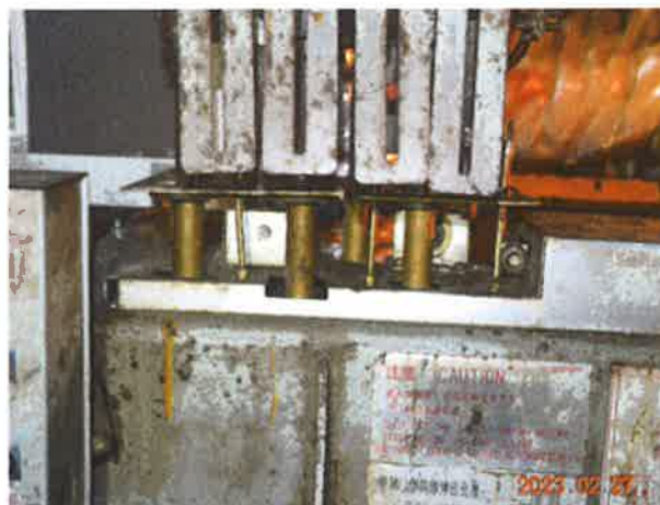
图 18: 超载检测装置失效