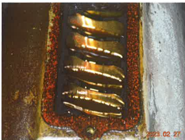
图 13: 传动副齿面未发现明显的啮合缺陷