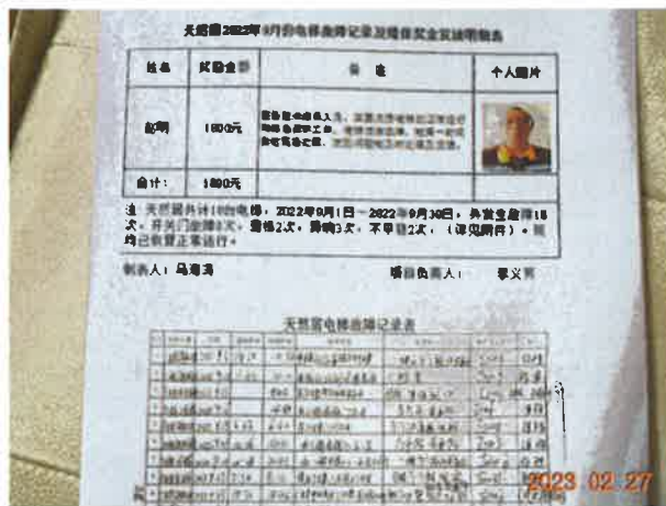
图 3: 查阅电梯相关的安全技术档案