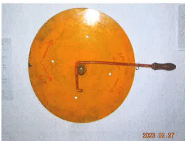
图 15: 可拆卸盘车手轮未设置电气安全装置