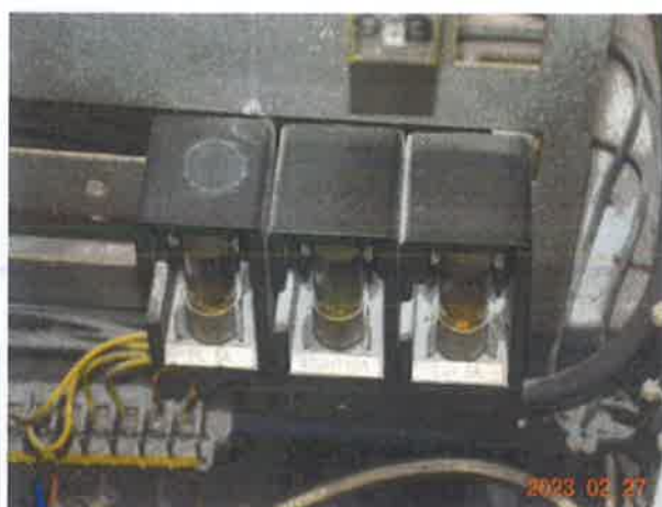
图 8：电气设备防护罩壳防护等级低于 IP2X