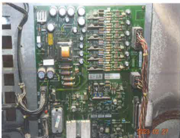
图 7：驱动装置变频器电子器件存在老化