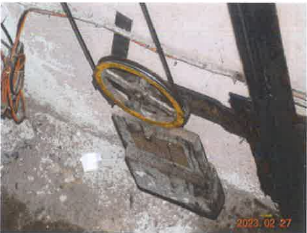
图 23：张紧轮旋转部件未设置防异物防护罩