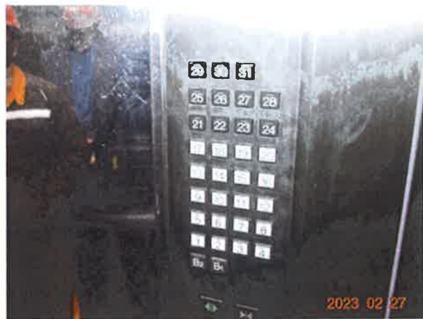
图 4: 轿厢操作装置部分按钮存在动作不良