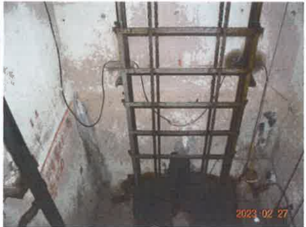
图 22：底坑对重运动区域防护不符合新规范