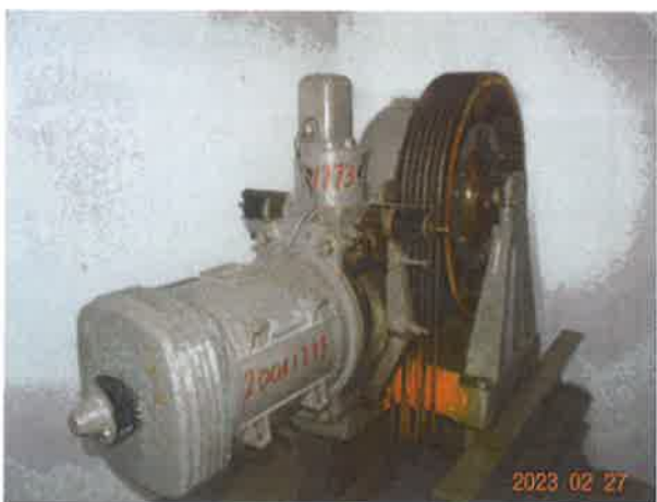
图 9：曳引轮未设置防止异物进入的防护装置