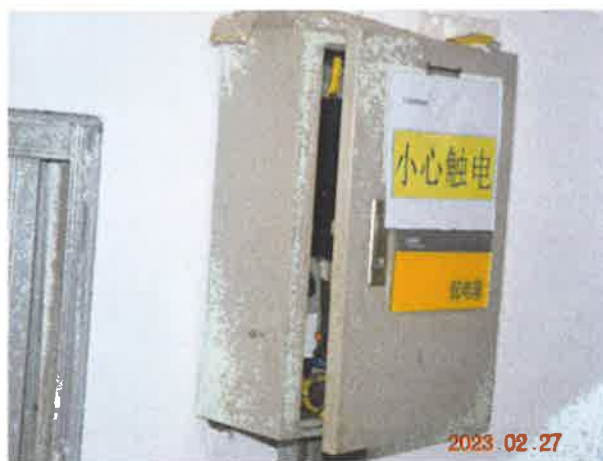
图 16: 主开关未设置防误操作保护