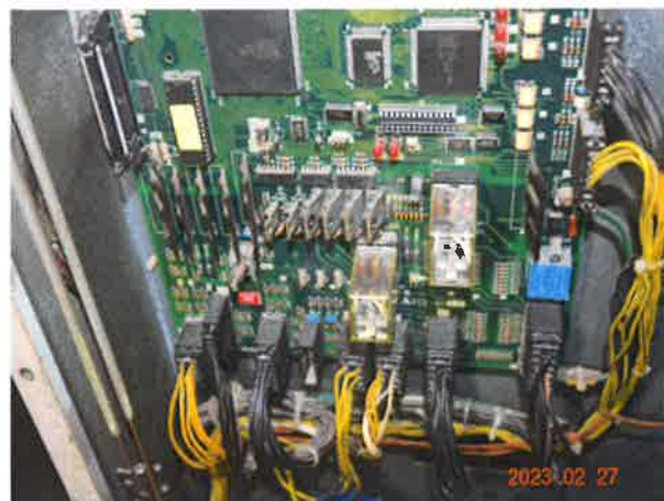
图 6: 控制主板电子元器件存在老化