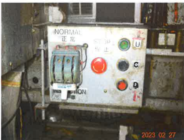
图 17: 轿顶检修急停装置无防误操作保护