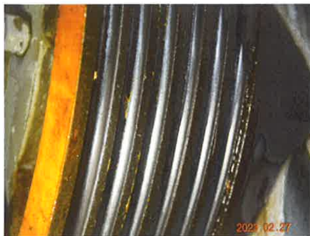
图 14: 曳引轮绳槽存在不规则的磨损