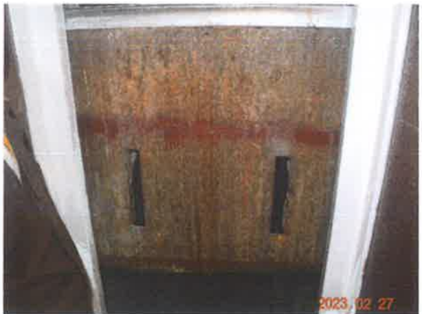
图 24：轿厢护脚板金属部件锈蚀