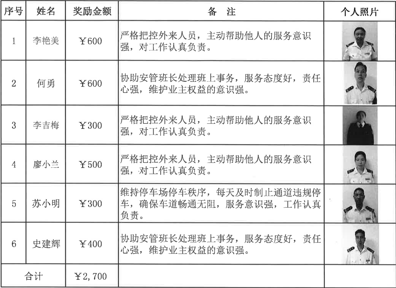
天然居2024年7月份门岗奖金发放明细表